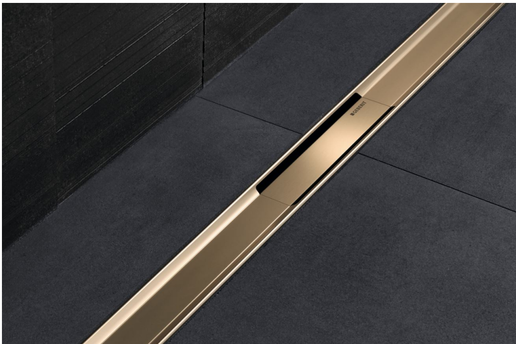
Nieuwe kleuren, beproefd concept: de Geberit CleanLine80 douchevloergoot in de kleur champagne

Nieuwegein, juni 2020 – Een hedendaagse badkamer toont een variatie aan materialen, kleuren, structuren en afwerkingen. Glanzend chroom wordt steeds vaker vervangen door nieuwe - vaak metallic - kleuren in een glanzende of matte afwerking. Inspelend op deze ontwikkeling breidt Geberit haar assortiment CleanLine douchevloergoten uit met de nieuwe CleanLine80. Dit model is zowel qua design als techniek verbeterd en het kleurenpalet valt direct op: er kan nu - naast rvs - ook gekozen worden uit de nieuwe metallic kleuren champagne en zwartchroom.